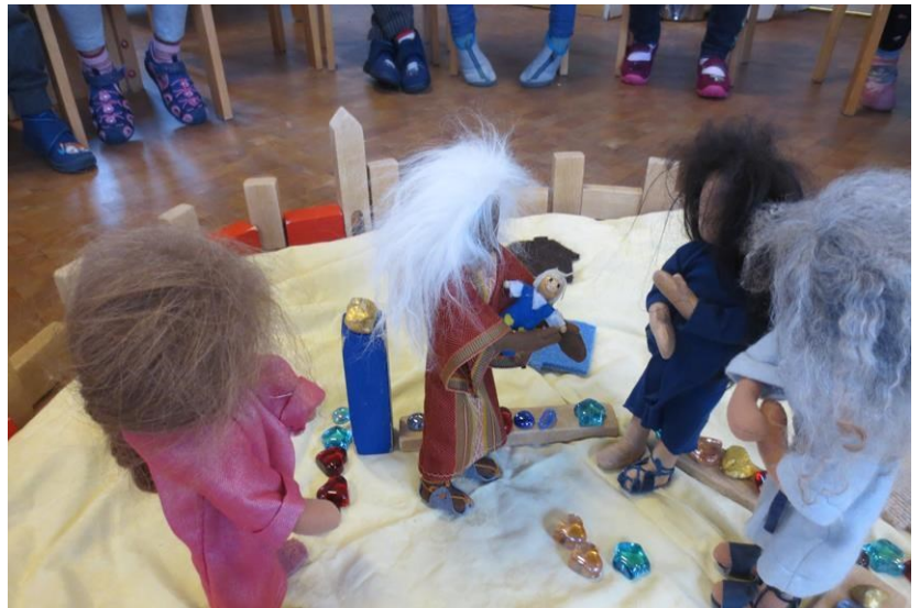
Jesus im Tempel